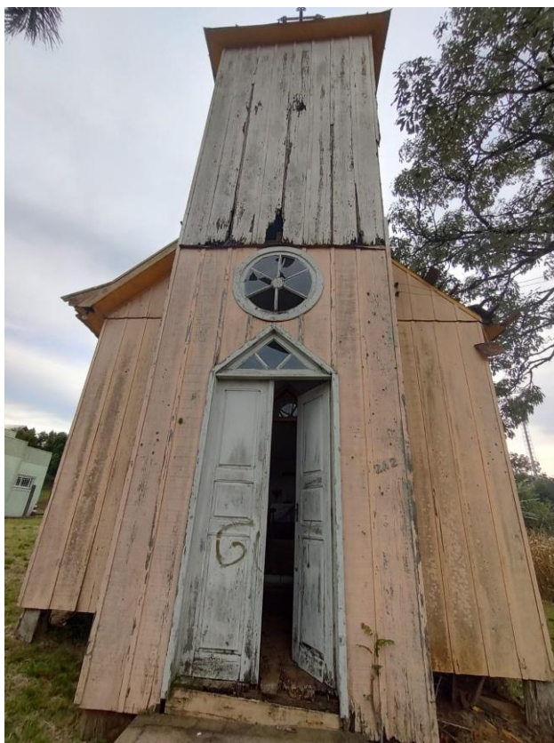
Imagem: Fachada Frontal.