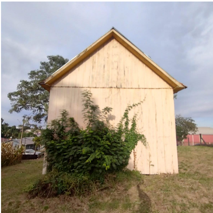
Imagem: Fachada dos fundos.