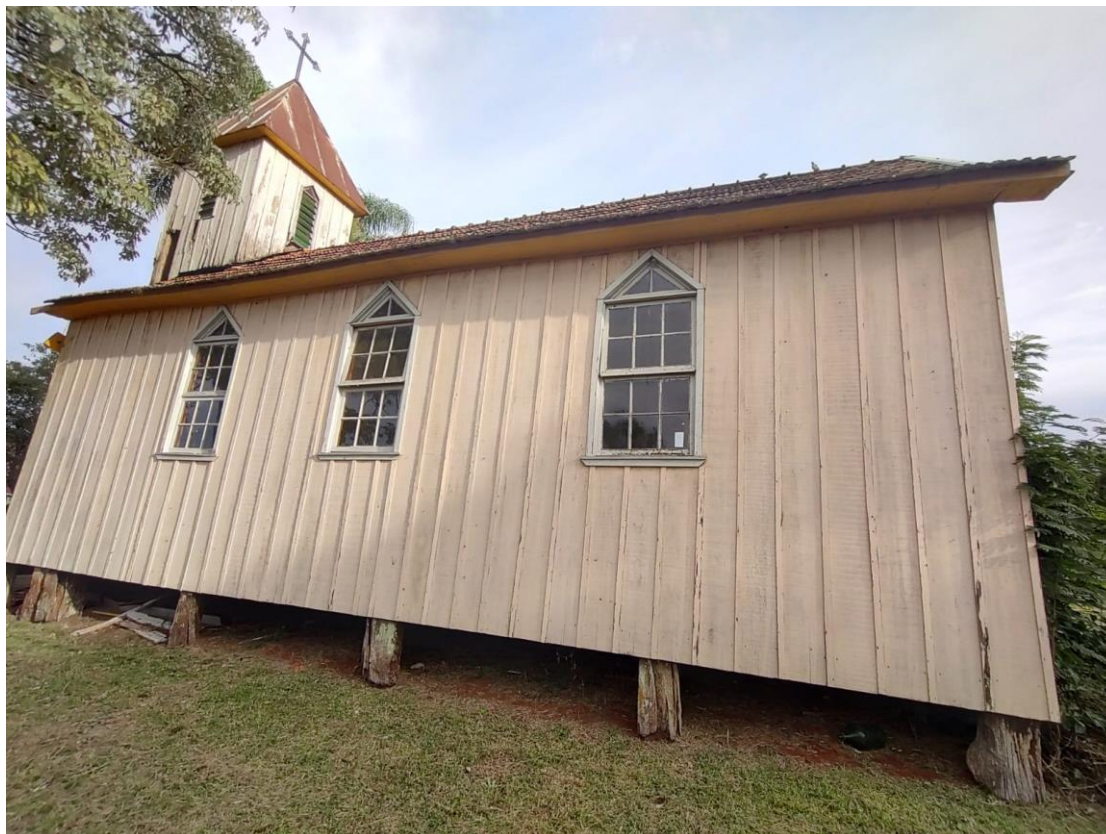
Imagem: Fachada Lateral.