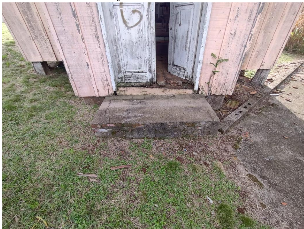
Imagem: Assoalho no hall de entrada.

“Coração Verde do Rio Grande. Doe Órgãos, Doe Sangue: Salve Vidas”