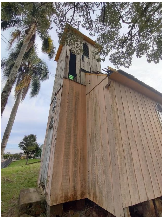
Imagem: Lateral do sino.