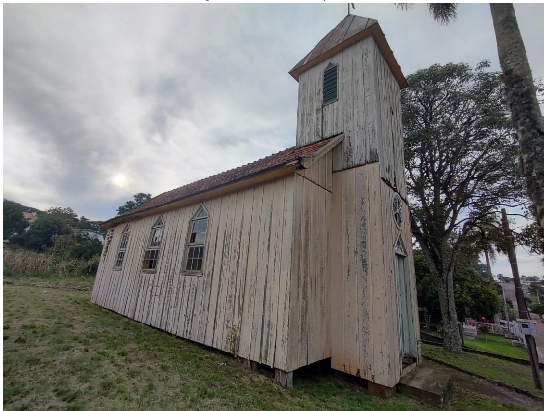
Imagem: Fachada Lateral.

“Coração Verde do Rio Grande. Doe Órgãos, Doe Sangue: Salve Vidas”