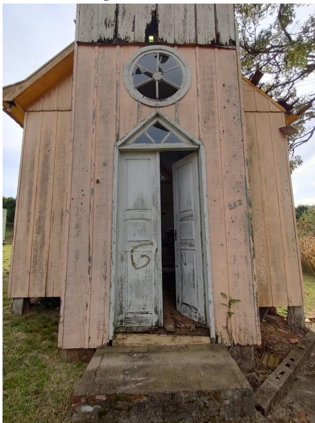
Imagem: Esquadrias na porta de entrada.

“Coração Verde do Rio Grande. Doe Órgãos, Doe Sangue: Salve Vidas”