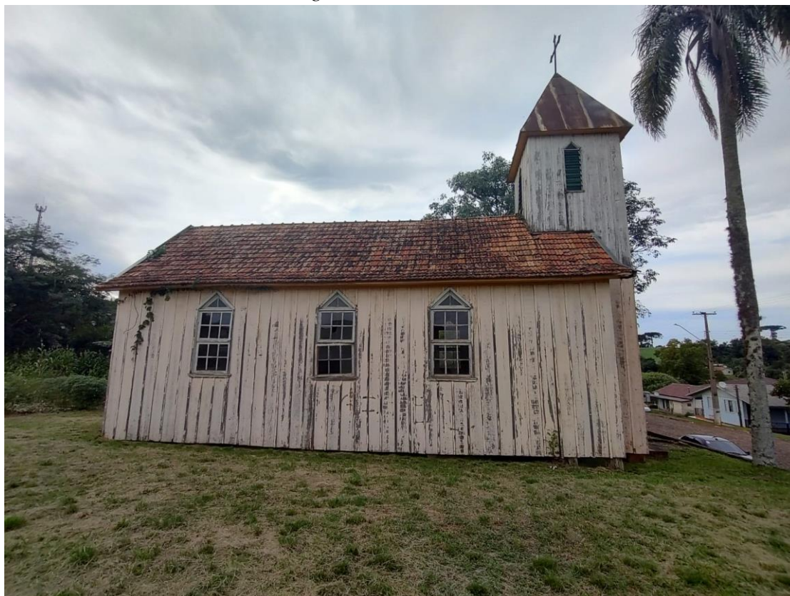
Imagem: Fachada Lateral.

“Coração Verde do Rio Grande. Doe Órgãos, Doe Sangue: Salve Vidas”