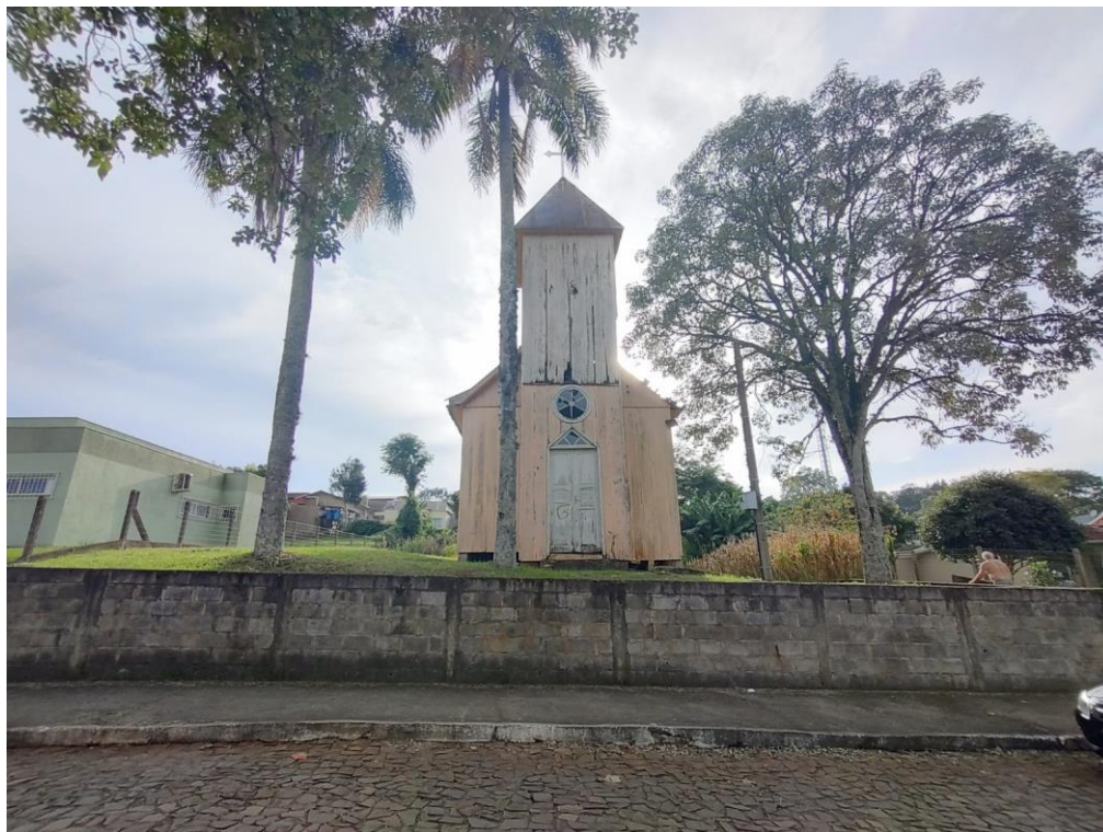
Imagem: Fachada Frontal.