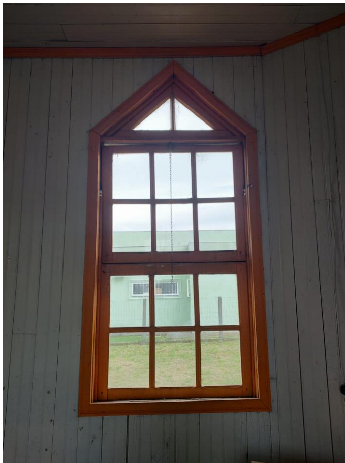
Imagem: Esquadrias Laterais.